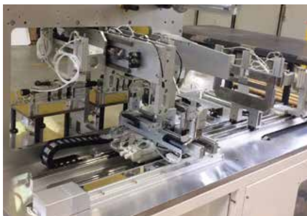
SISTEMI SU MISURA