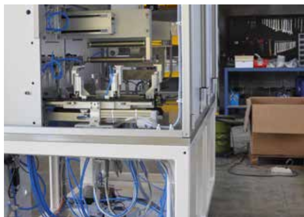
PROTOTIPI PER LABORATORI