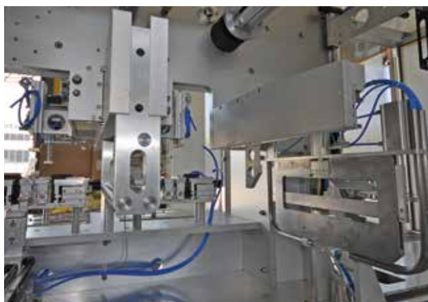
IMPIANTI IN ALLUMINIO