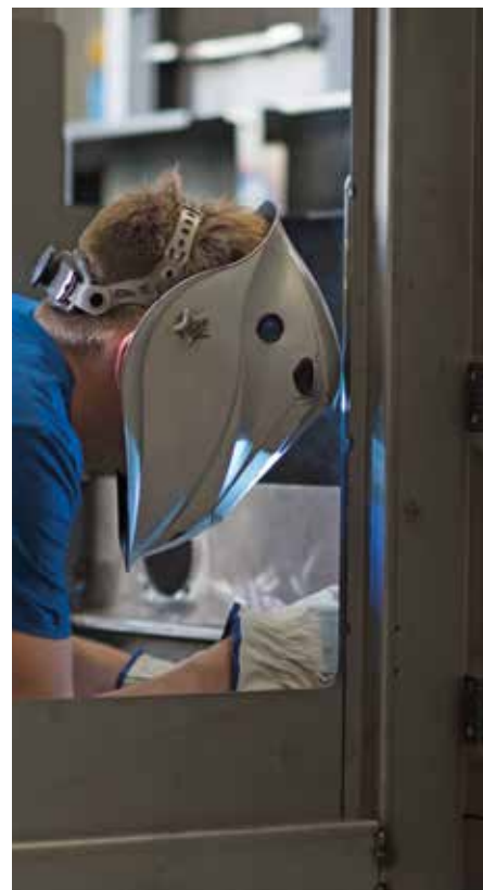
REALIZZAZIONE IMPIANTI IN ACCIAIO